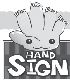
道路横断時の安全行動 イメージキャラクター「サイン(SIGN)ちゃん」