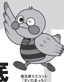
埼玉県マスコット「さいたまもち」