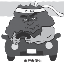
歩行者優先 イメージキャラクター 「さいたまお父さん」